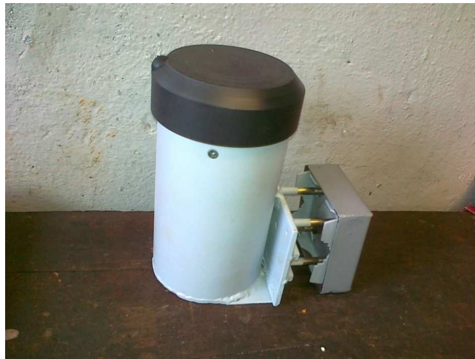
Prototyp jednotky ONI system pre vagóny