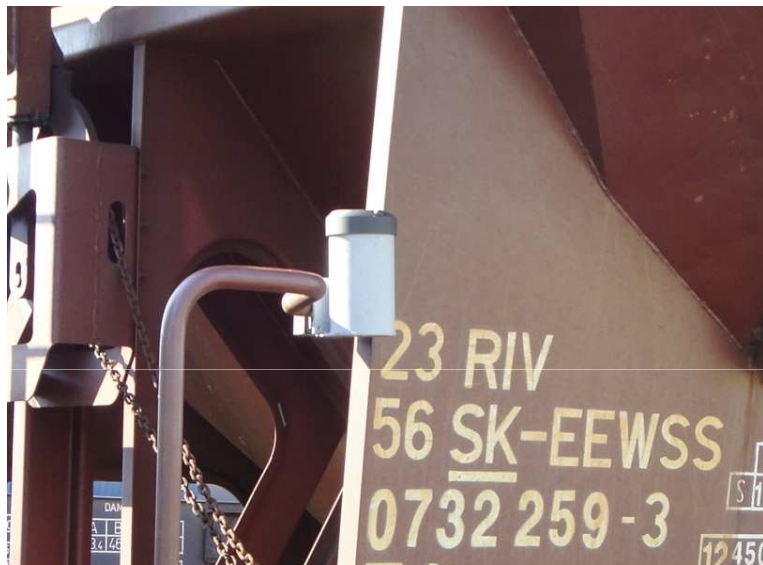
Monitorovanie pohybu vozňa systémom GPS / GPRS